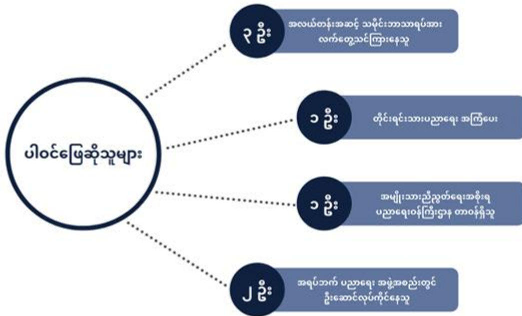
အင်တာဗျူးတွင် ပါဝင်ဖြေဆိုသူဦးရေနှင့် ၎င်းတို့၏ နောက်ခံ

အခြေမခံသည့် နည်းလမ်း (Non-probability Sampling Method) များထဲမှ ရည်ရွယ်ချက်အခြေပြု နမူနာကောက်ယူခြင်းနည်းလမ်း (Purposive Sampling) ကို ရွေးချယ်ခဲ့ပါသည်။